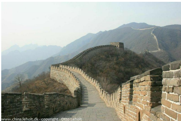
Figur 1 Den Kinesiske mur, som i årtusinder skulle beskytte Kina mod nomaderne i nord, og samtidigt et symbol på århundreders kinesisk isolation.

Frem til 221 f.Kr. bestod det kinesiske område af en lang række kongedømmer, som i skiftende alliancer havde samlet sig omkring den stærkeste af disse. Under Zhou-dynastiet (1046-221 f.Kr.) formes og nedskrives en lang række af de grundlæggende ideer og forestillinger, som i de næste årtusinder kommer til at kendetegne den kinesiske kultur og civilisation. Det gælder såvel yin-yang filosofien, daoismen og ikke mindst konfucianismen. Med Qin-dynastiet (221-206 f.Kr.) samles Kina for første gang under én kejser, som gennemfører en standardisering af skrift, mål, vægt, møntfod mv. og skaber det administrative statssystem, som skulle bestå mere eller mindre uændret i de næste to årtusinder.