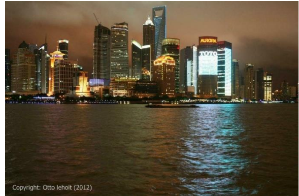
Figur 5 Shanghais' Pudong distrikt - det nye teknologiske og finansielle center i Kina, som blev udviklet efter 1992

2008 blev endnu et vendepunkt i Kina forhold til omverdenen. Med en spektakulær åbningsceremoni ved OL i Beijing i aug. 2008, kom der fornyet opmærksomhed på Kina. Da den internationale finanskrisen bryder ud kort efter, fortsatte Kina med økonomiske vækstrater på 8-10 %, og havde gennem sin eksport ophobet enorme valutaeserver. Hvor mange havde set den kinesiske vækst som en trussel mod de vestlige økonomier, blev det nu mere og mere klart, at Kinas fortsatte vækst var blevet den vigtigste motor for verdensøkonomien. Tre årtiers reformpolitik havde ikke bare løftet mere end 500 mio. kinesere ud af absolut fattigdom, men også skabt en velstående kinesisk middelklasse på mindst 2-300 mio. mennesker.