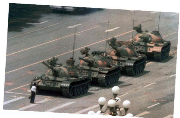
Figur 4 4. juni 1989 - Billedet af 'tank-manden' som i Vesten kom til at symbolisere den kinesiske borgers kamp mod militær undertrykkelse.

Da en lederartikel i Folkets Dagblad d. 26. april stempler demonstrationerne som "undergravende for det socialistiske system og en trussel mod KKP's ledende rolle", eksploderer antallet af demonstranter i de kommende dage. Studenternes krav var en tilbagekaldelse af lederartiklen fra 26. april, men i de efterfølgende forhandlinger mellem regeringen og studenterlederne viste det sig umuligt at finde et kompromis, der kunne tilfredsstille begge parter. Den 12. maj iværksatte en gruppe studenter en sultestrejke på Tian'anmen pladsen, og den 20. maj indførtes militær undtagelsestilstand i Beijing. Dette provokerede til yderligere demonstrationer og opførsel af vejbarrikader rundt om Tian'anmen pladsen. Demonstrationerne blev efter godt 7 uger bragt til ende da militæret blev sat ind for at rydde Tian'anmen pladsen d. 4 juni.