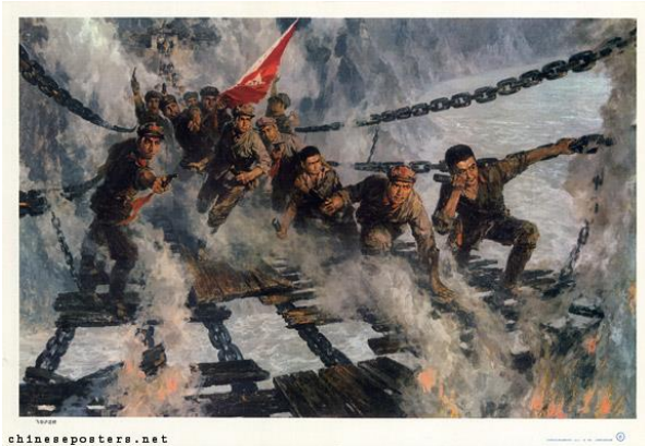
Figur 2 Propagandaplakat fra kommunisternes lange march - hvor nederlag vendes til sejr.

etablering og reorganisering af de to politiske partier, som i de næste årtier skulle kæmpe om at genetablere Kinas nationale genforening og uafhængighed; Guomindang (GMD) og Kinas Kommunistiske Parti (KKP).