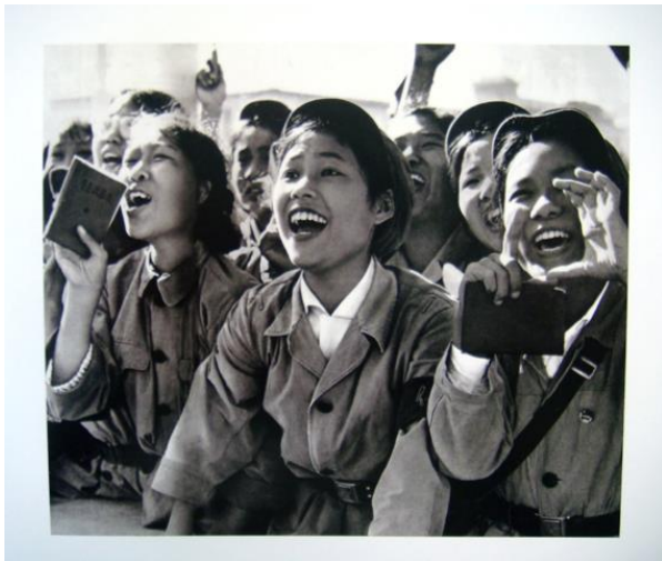
Figur 3 Unge kvindelige 'Rødgardister' hylder Formand Mao under Kulturrevolutionen i 1966 på Tian'anmen pladsen

som et politisk redskab til at genetablere Maos lederskab, og klassefjender kunne findes alle vegne - selv i KKP's øverste ledelse.